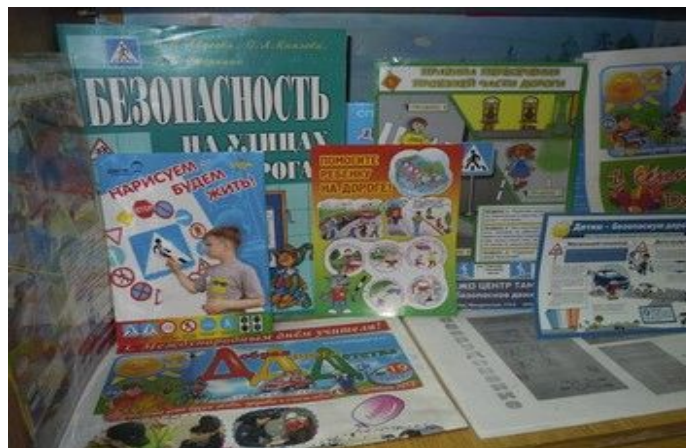
Фото на странице: 5