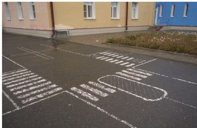
Фото на странице: 8