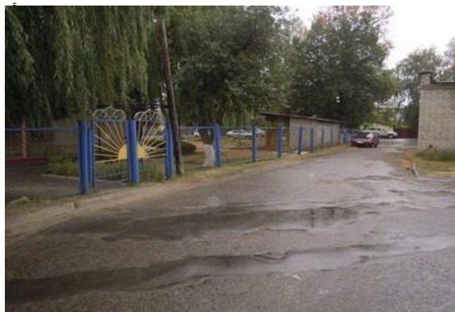
ул. Лесная, 29