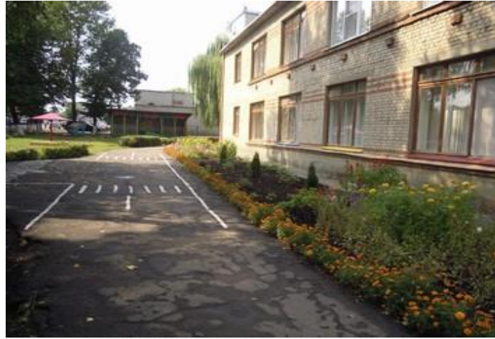
Фото на странице: 6