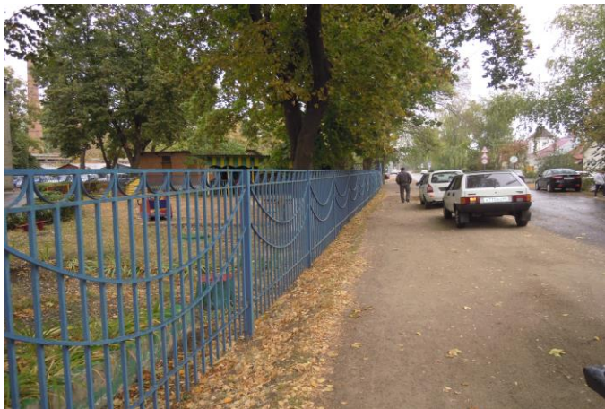
ул. Лесная, 29