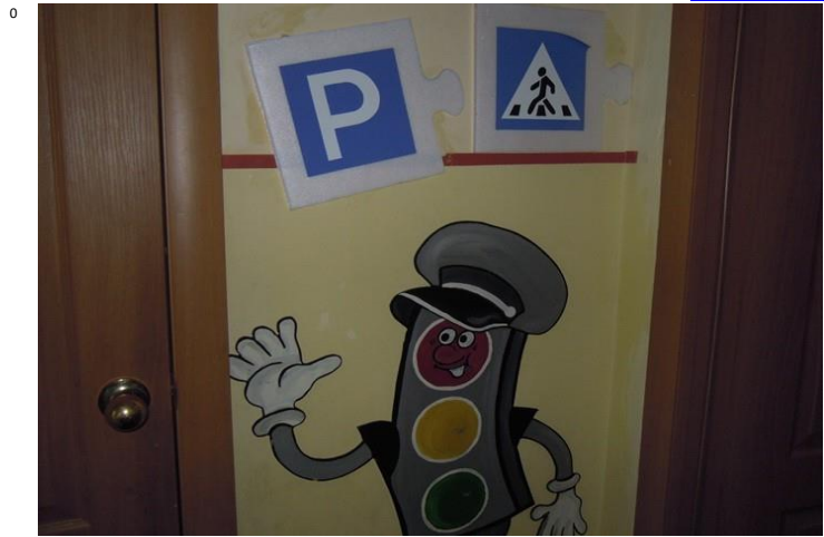
Фото на странице: 7