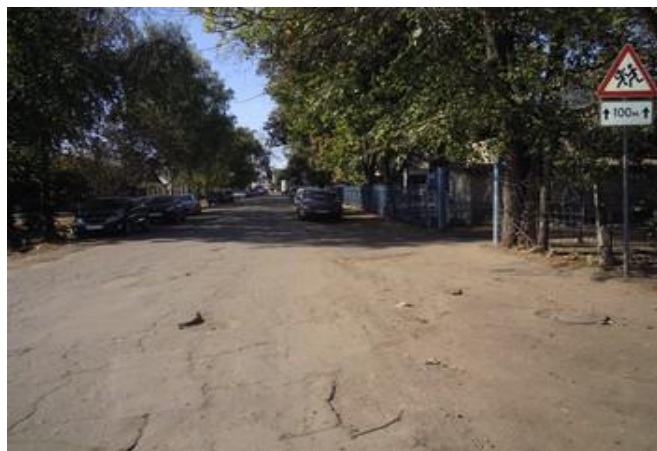
Фото на странице: 10