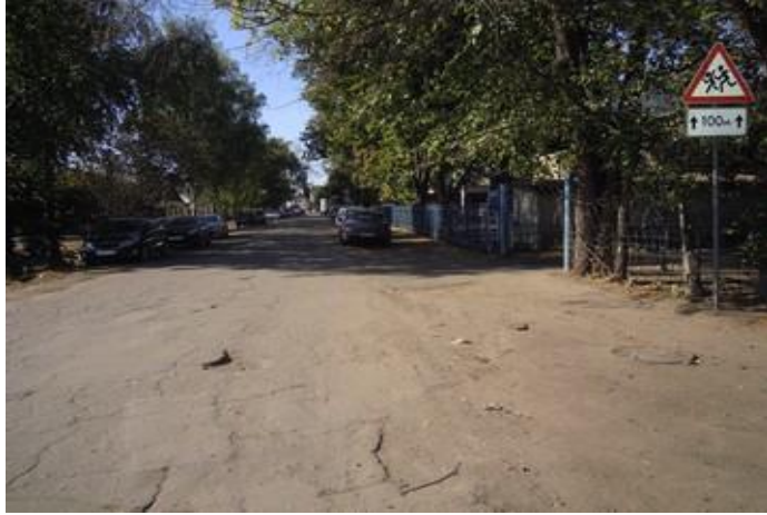
ул. Лесная, 29