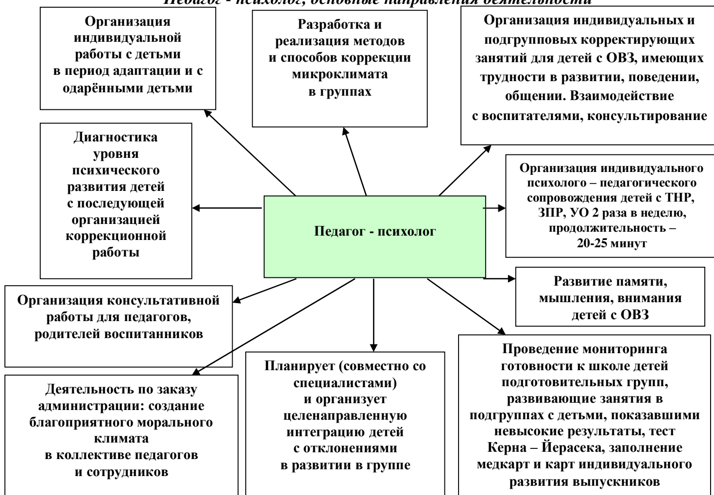
Рис. 2 «Педагог - психолог, основные направления деятельности»